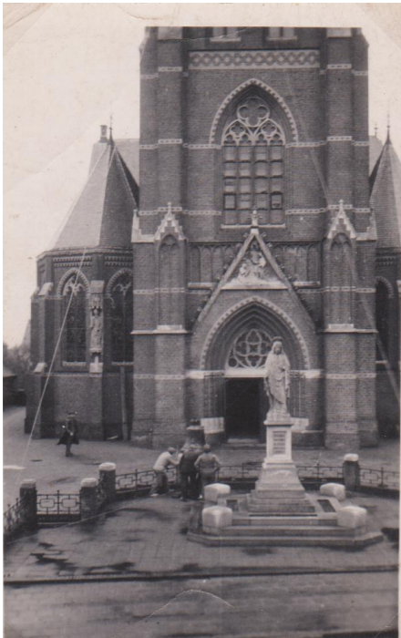
De kerkklokken werden op bevel van de Duitsers in 1943 uit de toren gehaald

ook met het aangename verenigd. De vele verenigingen zorgden voor ontspanning en waren met hun jubilea, processies en bedevaarten niet alléén de uitdrukking van het katholieke geloof.