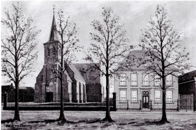
Oude kerk met daarnaast de pastorie gebouwd in 1827

De Rijenaren hebben in de schuurkerk aan de Heistraat gekerkt tot het einde van de Napoleontische tijd. Kerk en staat waren inmiddels gescheiden en in het nieuw ontstane Koninkrijk der Nederlanden had het landsbestuur geen zeggenschap meer over de godsdienst. Dankzij deze godsdienstvrijheid konden de katholieken voortaan weer openbare ambten bekleden en de eredienst openlijk uitoefenen. Hiermee eindigde het tijdperk van de schuurkerken. Bij koninklijk besluit van 17 juni 1815 werd de oude parochiekerk van Rijen terugggegeven aan de katholieke geloofsgemeenschap. Maar het kruiskerkje was tijdens de protestantse overheersing zelden gebruikt door het handjevol Calvinisten en verkeerde in vervallen toestand. Het was in de laatste jaren bovendien een speelzaal voor