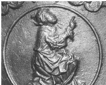
Medaillon van Catharina op de klok uit 1532