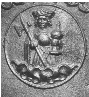
Medaillon van Maria Magdalena op de klok uit 1532