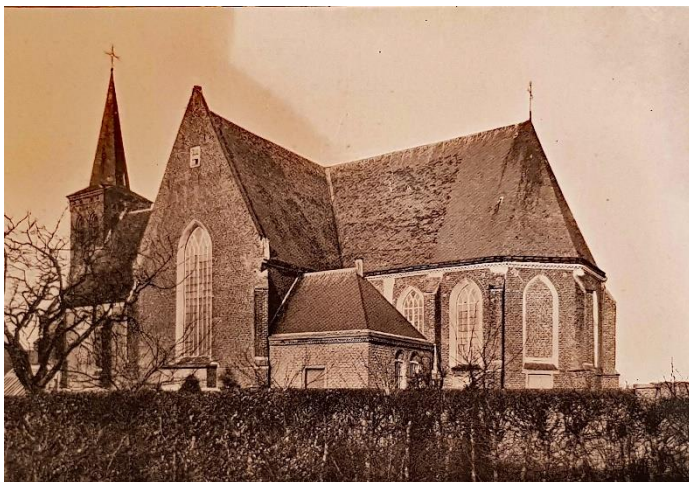
Zijaanzicht van het kruiskerkje in Rijen omstreeks 1904