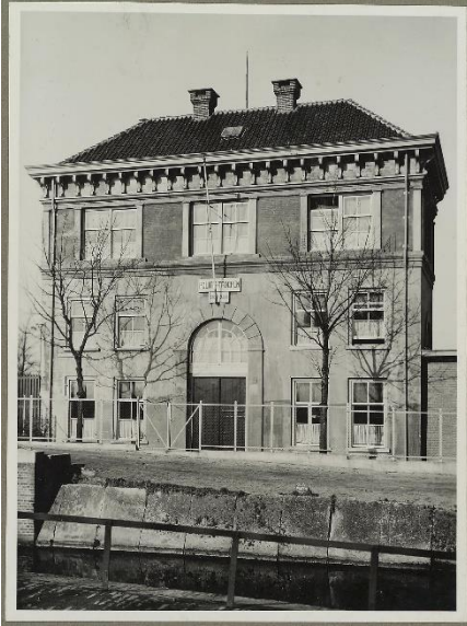
De oude kogelgieterij in Delft

Er is onduidelijkheid over de exacte overlijdensdatum in verschillende bronnen. Is Jos op de dag van de gevechten overleden of een dag later? Op de overlijdensakte die in oktober 1940 in Gilze en Rijen is opgemaakt wordt 13 mei genoemd en ook de Oorlogsgravenstichting houdt deze datum aan. Jos is 20 jaar geworden.