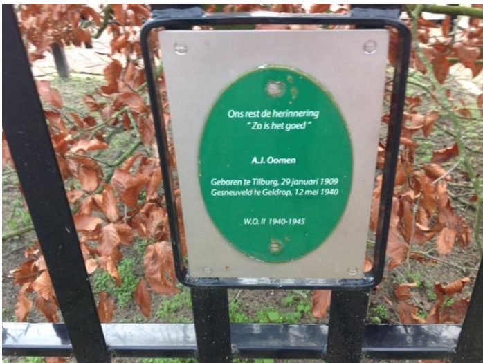
Plaquette bij de boom in Molenschot die genoemd is naar Janus Oomen

Janus Oomen is aanvankelijk begraven op de RK begraafplaats aan het Bogaardseind en daarna is hij in oktober 1966 herbegraven op de begraafplaats 't Zand in Geldrop. Belangstellenden kunnen zijn graf daar nog vinden (vak G, rij 11 nr. 2). Hij is nooit naar een ereveld verplaatst