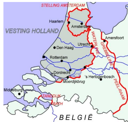
De Vesting Holland