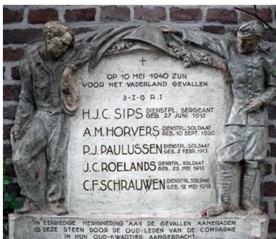
Monument bij kasteel 'Tongelaar' in Mill ter nagedachtenis aan de vijf omgekomen militairen in kazemat 37

Voor hun inzet en standvastigheid werd aan Piet, samen met de andere omgekomen militairen van de kazemat, postuum het Bronzen Kruis toegekend. Piet kreeg op 11 mei een veldgraf naast de kazemat en werd op 14 mei in Mill begraven. Op 10 juni werd hij herbegraven op de begraafplaats in Gilze en op 12 november 1990 werden zijn stoffelijke resten overgebracht naar het Militair ereveld Grebbeberg in Rhenen (rij 6A, graf 9). Ter nagedachtenis aan de vijf Nederlandse militairen van het 3-I 6e Regiment Infanterie die op 11 mei 1940 in de strijd tegen de bezetter zijn omgekomen, is een monument in kasteel 'Tongelaar' in Mill opgericht. Dit kasteel was in de meidagen van 1940 in gebruik als kwartier van het legeronderdeel van Piet. In Gilze is er een straat naar Piet Paulussen genoemd.