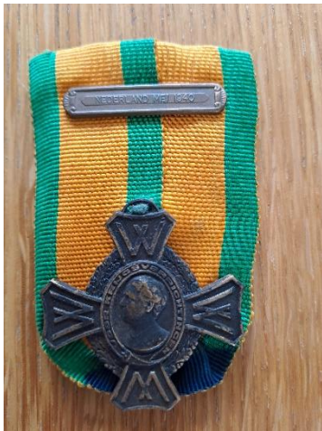
Oorlogsherinneringskruis met de Gesp voor Janus Pijpers

Naast de doden vielen er meer dan 150 gewonden. Velen van hen waren ernstig verminkt, leden aan brandwonden of verloren armen en/of benen. De soldaten waren vooral reservisten. Ook meer dan 100 paarden van de cavalerie werden gedood als gevolg van het bombardement. Vele paarden waren ernstig gewond geraakt en moesten worden afgemaakt door