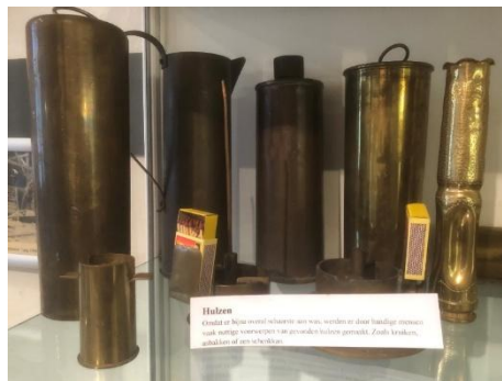
Gemaakt van koperen hulzen, restmaterialen van de oorlog

Door de schaarste waren er niet genoeg producten voor iedereen. Distributiebonnen zorgden voor een eerlijke verdeling van wat er beschikbaar was. En van 'restmaterialen' van de oorlog maakten handige mensen zelf spullen. In de tentoonstelling vind je zelfgemaakt houten speelgoed uit die tijd. En diverse attributen die van gevonden koperen hulzen zijn gemaakt, zoals kruiken, schenkkannen, asbakken en sierkannen. Met creativiteit en handigheid maakten de mensen het leven weer zo aangenaam mogelijk.