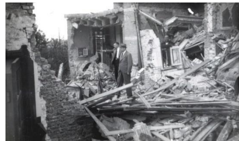
Kerk en school in Hulst door bommen vernield