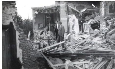
Kerk en school in Hulst door bommen vernield