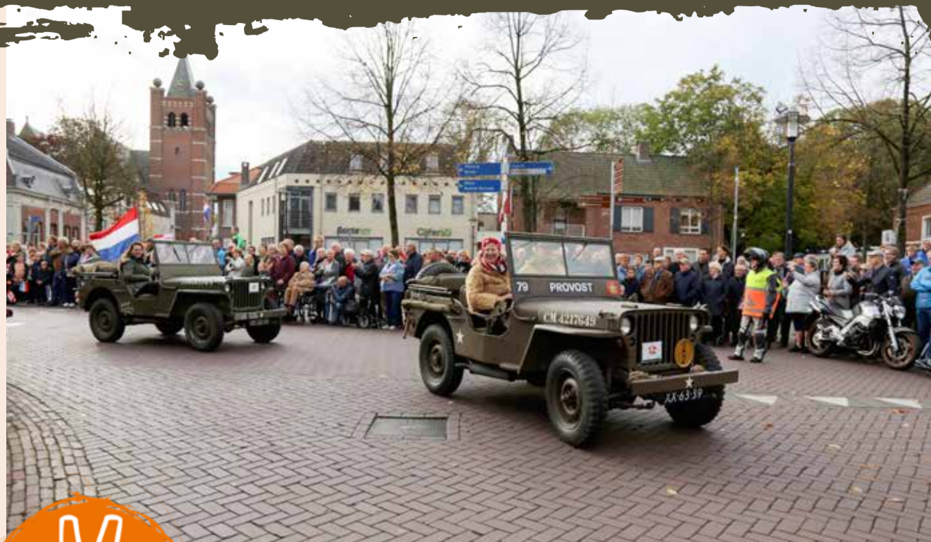
Historische tocht door het centrum van Gilze in oktober 2019.