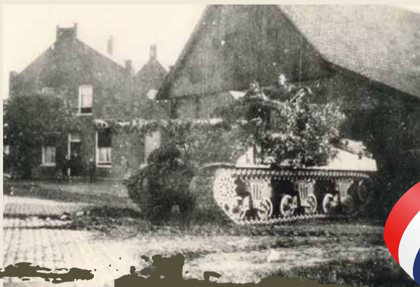
Foto: Bevrijding Gilze in oktober 1944. Poolse tank op de hoek van de Oranjestraat en Chaamseweg.

Dinsdag 19 november 2024 Cultureel Centrum De Boodschap Nassaulaan 62 in Rijen Aanvang: 19.30 uur