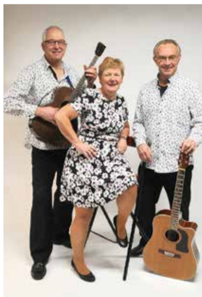
Trio Zand, Zeep en Soda.