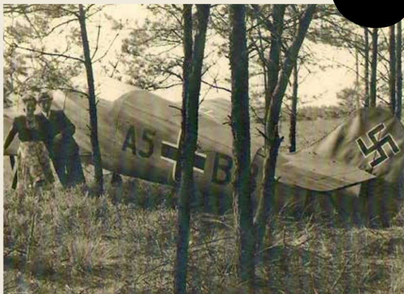
Foto: Schijnvliegveld 'De Kiek' tussen Alphen en Goirle. Fietstip: fiets over het Bels Lijntje en neem een kijkje op de locatie.