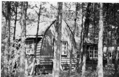
Geboortjes op het vliegveld Molenheide