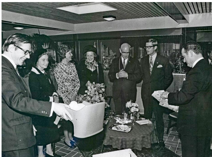
21 oktober 1972, de sporthal in Rijen geopend door prinses Margriet

In 1971, het jaar waarin de bouw van huizen in het uitbreidingsplan "De Vijf Eiken" in volle gang was, werd begonnen met het realiseren van een sporthal en zwembad aan de Mgr. Schaepmanstraat. De gemeente schreef een prijsvraag uit voor de naamgeving. De winnaar zou worden beloond met een prijs van honderd gulden. Maar toen duidelijk werd dat prinses Margriet de hal zou openen, kwam de naamwedstrijd op losse schroeven te staan. Het kon nu niet anders dan "Margriethal" gaan heten.