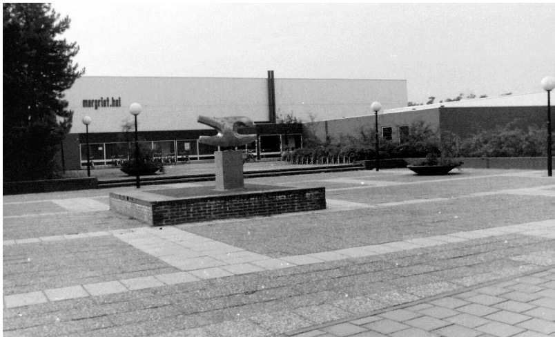
Margriethal, ca 1985

het enige recreatiebad in West-Brabant. Het unieke bad was direct een groot succes en trok bezoekers uit de wijde omgeving. Je kon er met je gezin naar toe, er werden kinderfeestjes gehouden en er was een sportkantine. Later kwamen er ook een sauna en een zonnebank. In de eerste jaren kreeg het bad meer dan 250.000 gasten, terwijl de gemeente had gemikt op hoogstens 160.000. Naar Rijens voorbeeld kwamen er in de